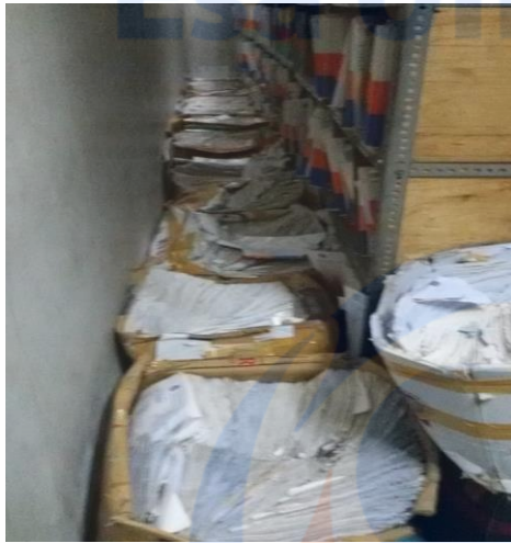
Foto Rekam Medis Inaktif