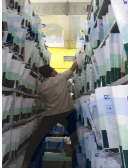
Foto Rak Rekam Medis Aktif